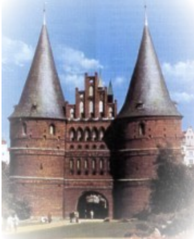
Holstentor in Lübeck

Im Süden von Groß Grönau eröffnet sich der einmalige Naturraum des Naturparks Lauenburgische Seen. Hier kann man dank einer 40 jährigen Ruhepause am Rande des ehemaligen Grenzstreifens zur DDR seltenste Flora und Fauna antreffen.