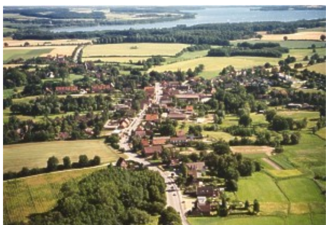
Groß Grönau aus der Luft mit Ratzeburger See

Groß Grönau liegt im Süden der Hansestadt Lübeck und am nördlichen Rande des Naturparks Lauenburgische Seen. Durch seine Lage ist Groß Grönau wie geschaffen zum Ausgangspunkt für Reisen in diese "zwei Welten": Zum einen in eine kulturell wertvolle Stadtgeschichte, zum anderen in ein idyllisches Naturerlebnis. Dabei erleichtern in Groß Grönau ein gut ausgebautes Rad- und Wanderwegnetz sowie angenehme Anbindungen an den Öffentlichen Nahverkehr den Weg in beide Richtungen.